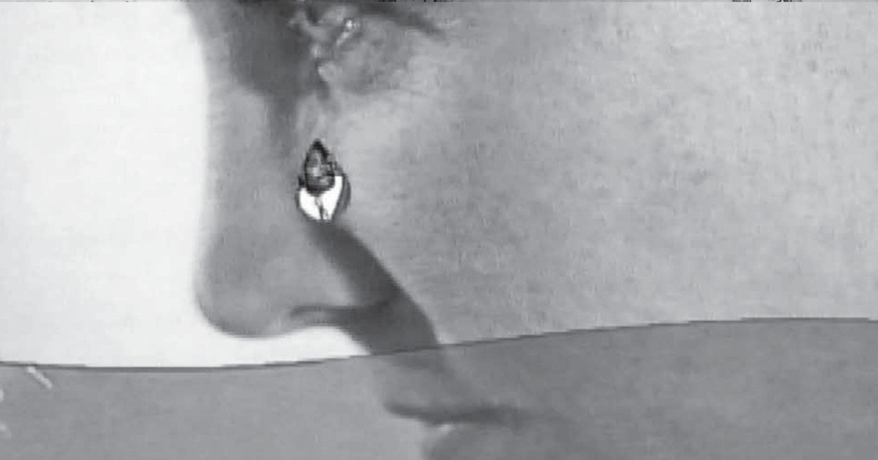
LYNN HERSHMAN LEESON Seduction of a Cyborg , 1994.