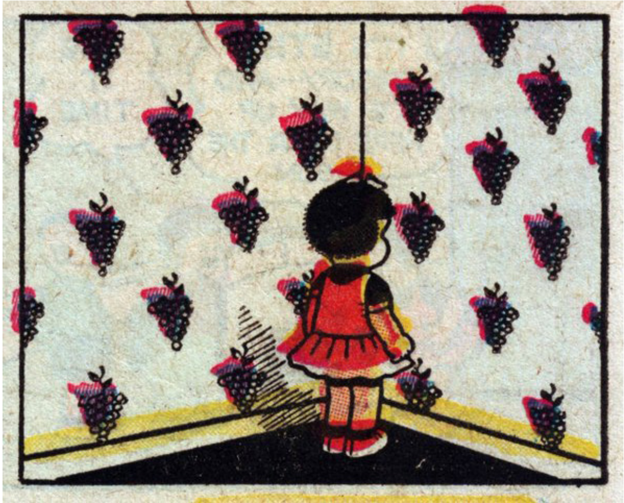
Martín Legón Booths , 2017. Medidas variables